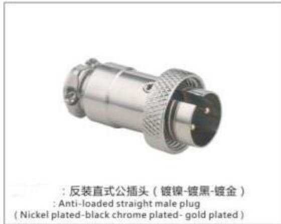
产品展示图 Product Display