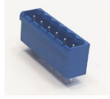
5,08 mm SKBK (10.606)